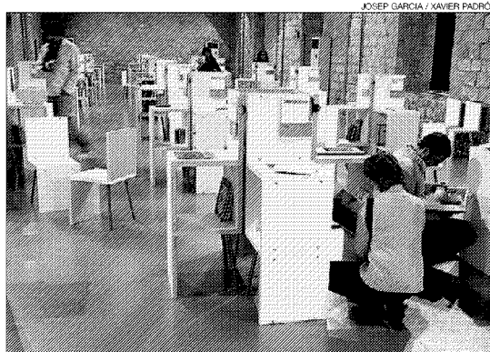
► Lectores en la muestra del FAD. En la silueta, libros de Media Vaca.

son siete editoriales -Libros del Asteroide, Impedimenta, Nórdica, Periférica, Sexto Piso, Barataria y Global Rhythm- que mantienen su independencia pero di-