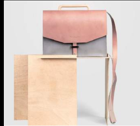
Two Hands Madrid. Expositor DM22