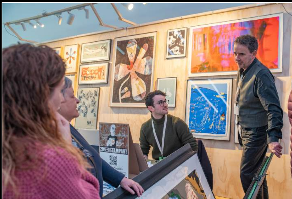
Apart Edicions. Expositor Premium DM22