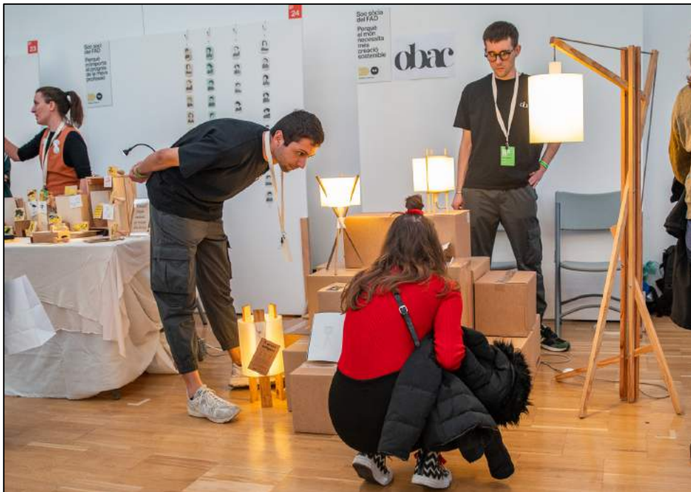
Lum de l'Obac. Expositor DM22

Muntatge expositors 9h a 14h Recollida de 20h a 22h