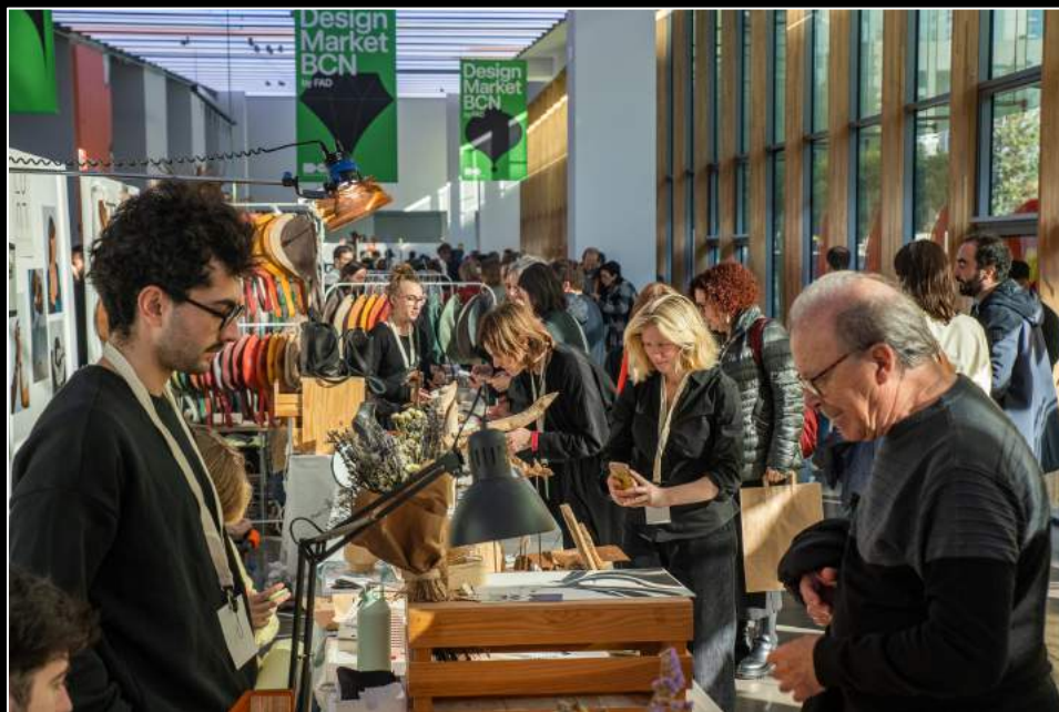
Design Market Barcelona 2022