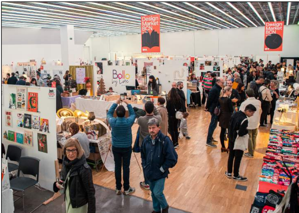
Design Market Barcelona 2022

La 11a edició del Design Market Barcelona organitzat per Foment de les Arts i del Disseny (FAD) reunirà per tres jornades els millors artistes i creadors, nous talents, dissenyadors independents i les marques més rellevants de l'avantguarda del disseny independent. Comissariat conjuntament per les diferents associacions del FAD, és el mercat de referència per als amants del bon disseny i cada any congrega a prop de 10.000 visitants. Aquests trobaran els millors productes en les diferents expressions del disseny: objectes per a la llar i la persona, moda i complements, joieria contemporània, publicacions, elements gràfics, mobiliari, il·lustració, il·luminació, art i artesanía.