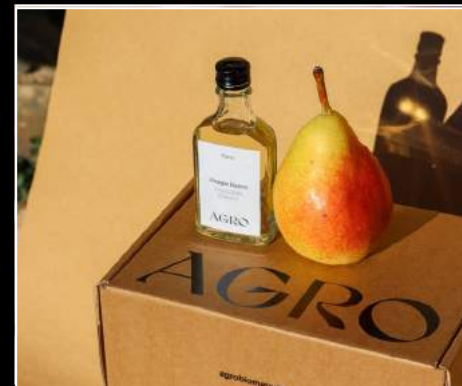
AGRO Biomaterials. Expositor DM22