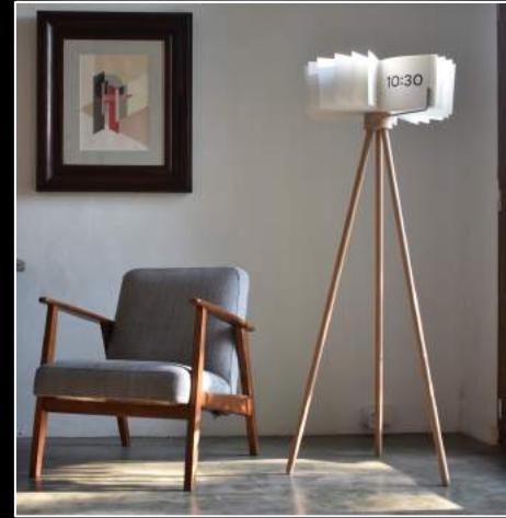
NRH clock design. Expositor DM22

El comité de selección da preferencia a solicitantes que lanzan nuevos productos y/o no se ven regularmente en otros mercados. La selección es comisariada, por lo que cada solicitud se evaluará individualmente. La participación en ediciones anteriores no garantiza que la solicitud sea aceptada.