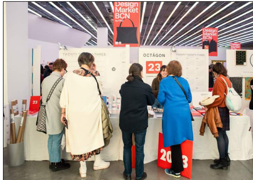
Octàgon. Expositor Premium DM22

La 11ª edición del Design Market Barcelona organizado por Fomento de las Artes y del Diseño (FAD) reunirá por tres jornadas a los mejores artistas y creadores, nuevos talentos, diseñadores independientes y las marcas más relevantes de la vanguardia del diseño independiente. Comisariado conjuntamente por las diferentes asociaciones del FAD, es el mercado de referencia para los amantes del buen diseño y cada año congrega a cerca de 10.000 visitantes. Éstos encontrarán los mejores productos en las diferentes expresiones del diseño: objetos para el hogar y la persona, moda y complementos, joyería contemporánea, publicaciones, elementos gráficos, mobiliario, ilustración, iluminación, arte y artesanía.