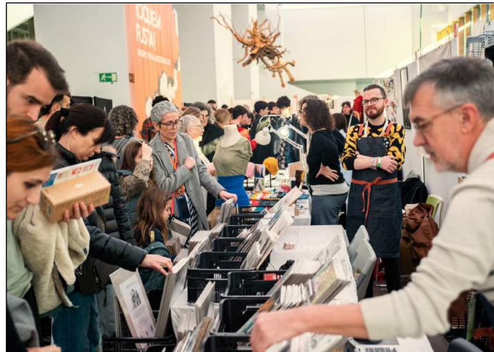
Taller Balam. Expositor Premium DM22

Montaje expositores 9h a 14h Recogida de 20h a 22h