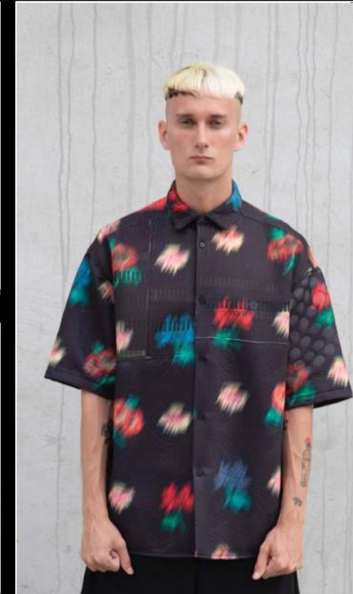
Gr3co. Expositor DM22